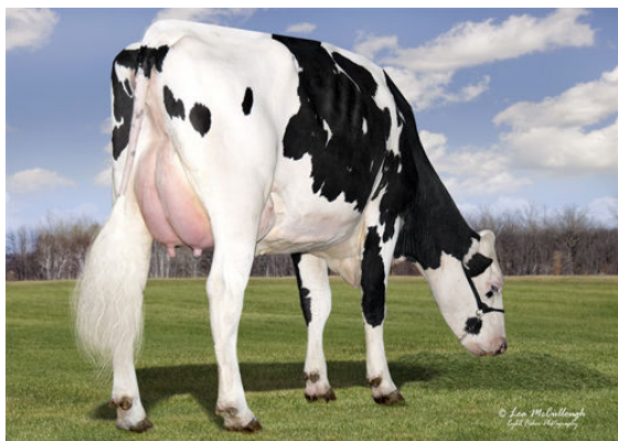
VANDOSKES DEBUT 3341